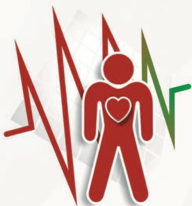
PRZYSPIESZONA CZYNNOŚĆ SERCA